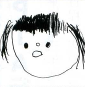
絵：たかつじゅうへい

① 小さい子のお話をしたり、おしゃべりしたり、一緒に遊んだりするのが好きだから。