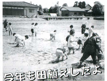
今年も田植えしたよ