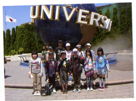
ユニバーサル・スタジオ・ジャパン