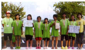
女子 新郷ガールズA 準優勝