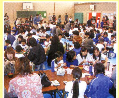
さつま汁の食事風景