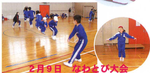
2月9日 なわとび大会