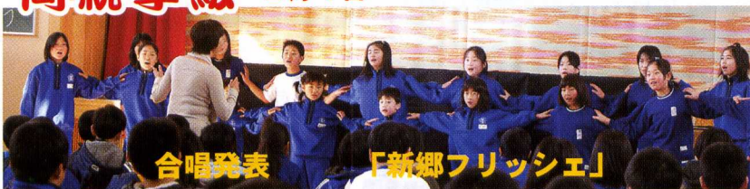
合唱発表 「新郷フリッシュェ」