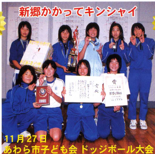
11月27日 あわら市子ども会 ドッジボール大会