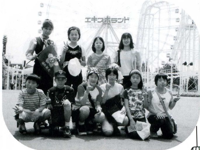
5月17日・18日 修学旅行 (京都・奈良・大阪)