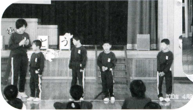
4月27日 新入生を迎える会