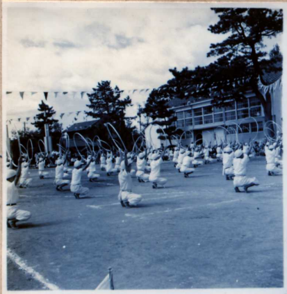
半輪体操(3・4・5・6男)