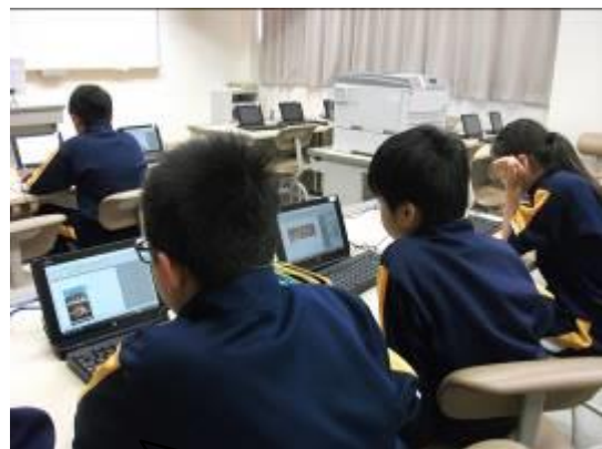
見学先について調べる6年生

6月2日は、1・2・3年の 遠足 です。行き先はエンゼルランド。リニューアルした施設で、学年毎にサイエンス体験をし、その後、縦割り班で館内を回ったり外で遊んだりします。協力や思いやりを育てたり、科学の不思議を感じたりするいい機会です。思いっきり楽しんでほしいです。