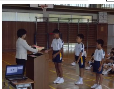
表彰式 頑張りが認められるのはうれしいことですね。