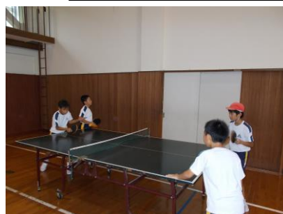
クラブ活動で、バスケ・バレー・卓球に分かれて活動。