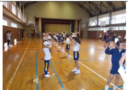
フェスタに向けて、ハピネスダンス・ヤーヤー踊り・どっしやどっしやの練習