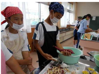
収穫したサツマイモで、スイートポテト作り（5・6年） 北潟名産サツマイモは、やはりおいしかったです。