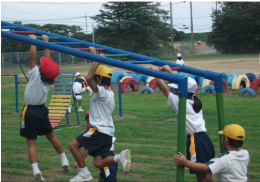
遊具広場で元気に遊ぶ子どもたち(8/29)

長い夏休みを終え、全員が元気に登校しました。「プールが楽しかったよ。」「親戚の家に行ったよ。」「バーベキューをしたよ。」など、たくさんの楽しい話を聞かせてくれました。4年から6年生は、カヌーポロ大会で頑張ったことも、よい思い出になったようです。前期後半も、みんなが自分の力を発揮し楽しく過ごすことができるよう、力を尽くしていきます。まず、大きな行事である運動会があります。子どもたちにとって楽しく、そして頑張ったという運動会になることをめざして、取り組んでいきます。これからも、ご理解ご協力をよろしくお願いたします。