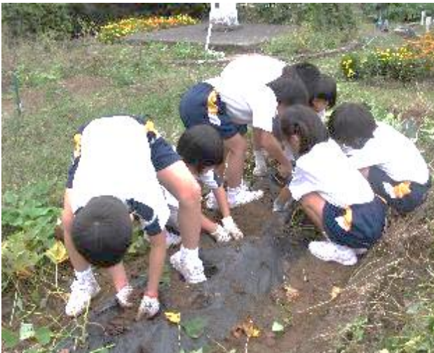
昭和60年頃の芋ほりの様子